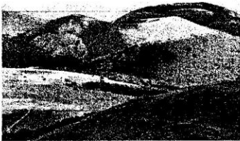
Le Massif Central