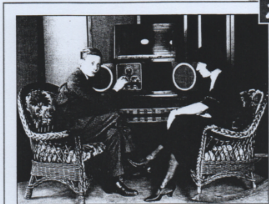
Un premier poste de radio dans un foyer