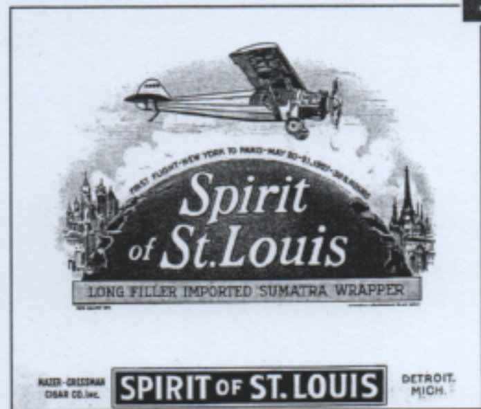
L'avion de Charles Lindbergh, le Spirit of Saint Louis (1927)