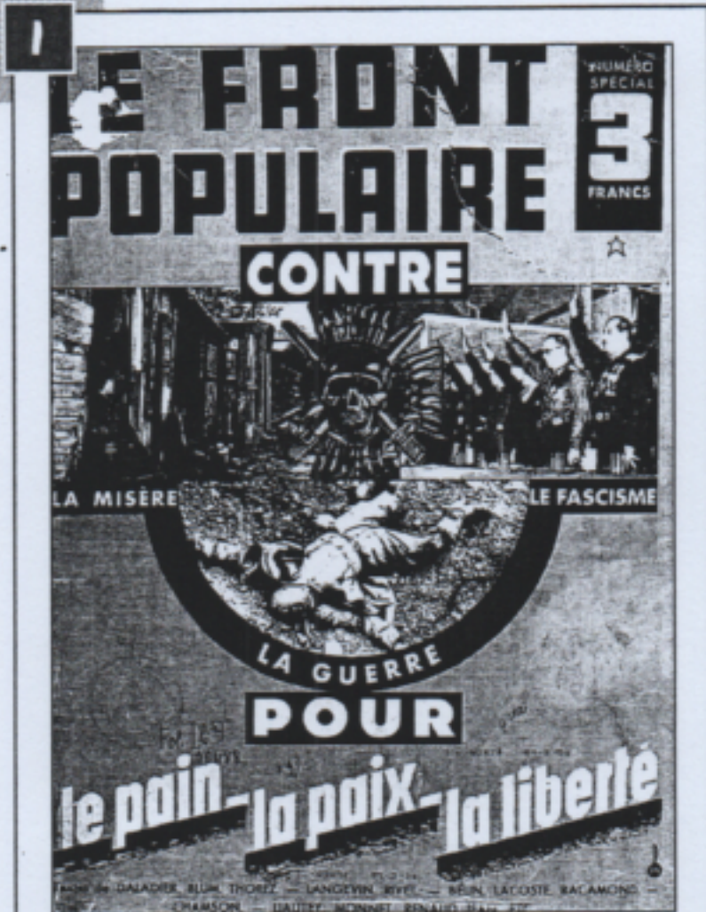
Une brochure du Front populaire en 1936