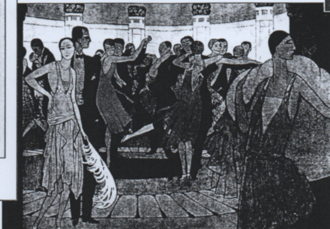
Paris la nuit dans un dancing de Montmartre, vers 1925