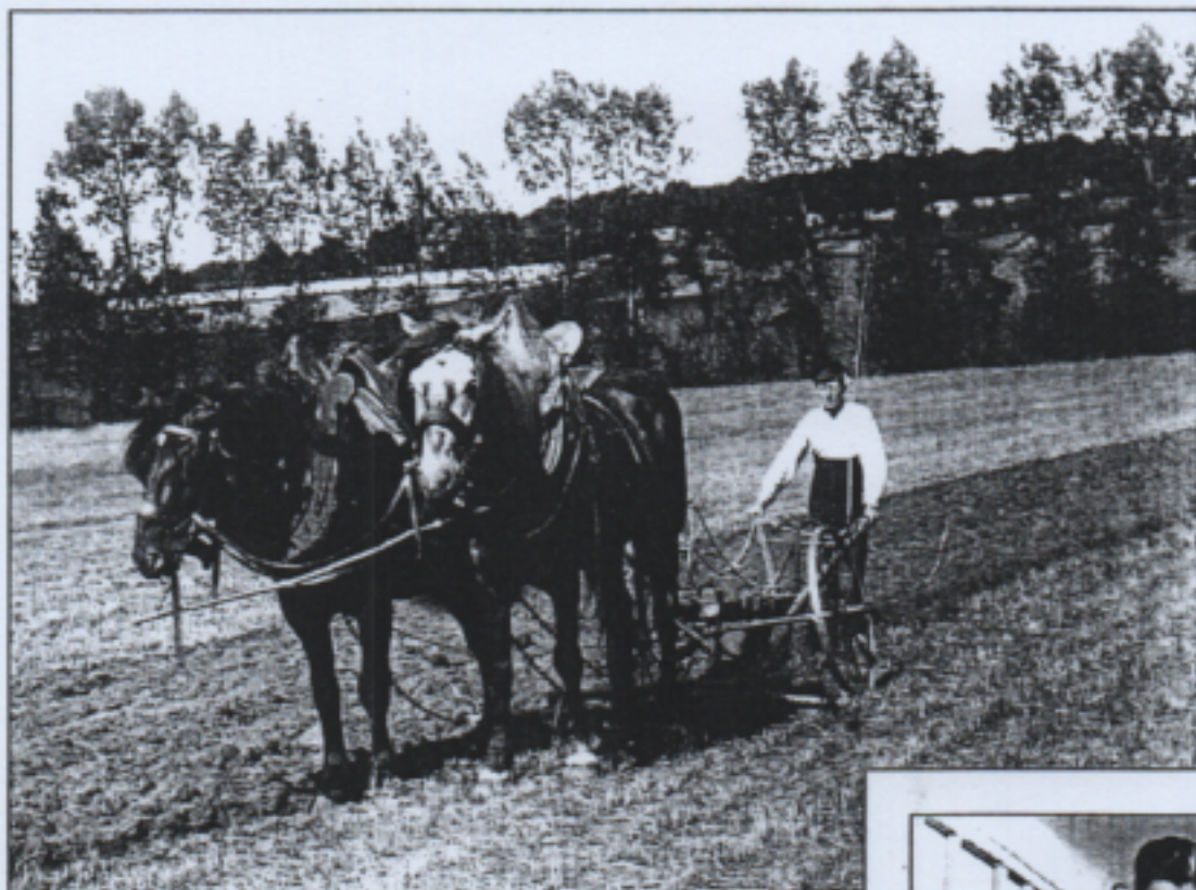
3 Scène de labour vers 1920