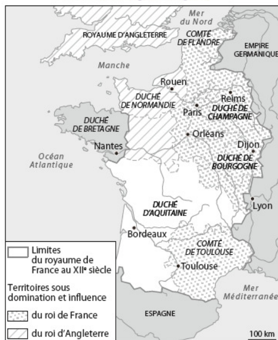
Carte 1 • Aliénor est reine de France : le duché d'Aquitaine est intégré au domaine royal français.